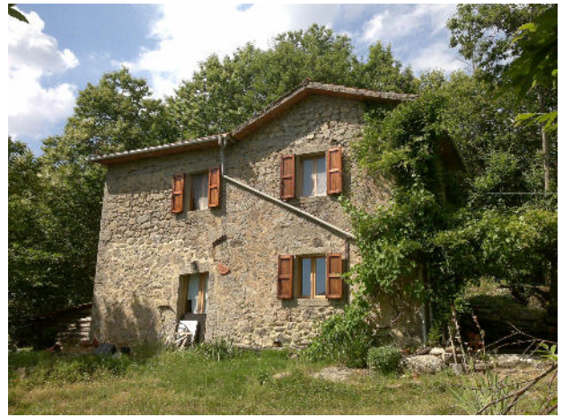
foto di insieme