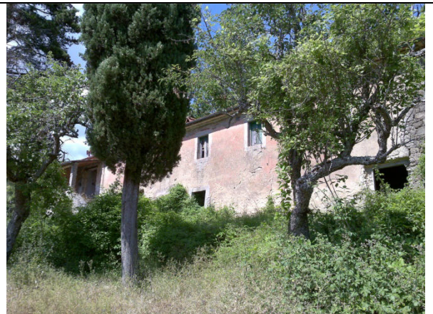
foto di insieme