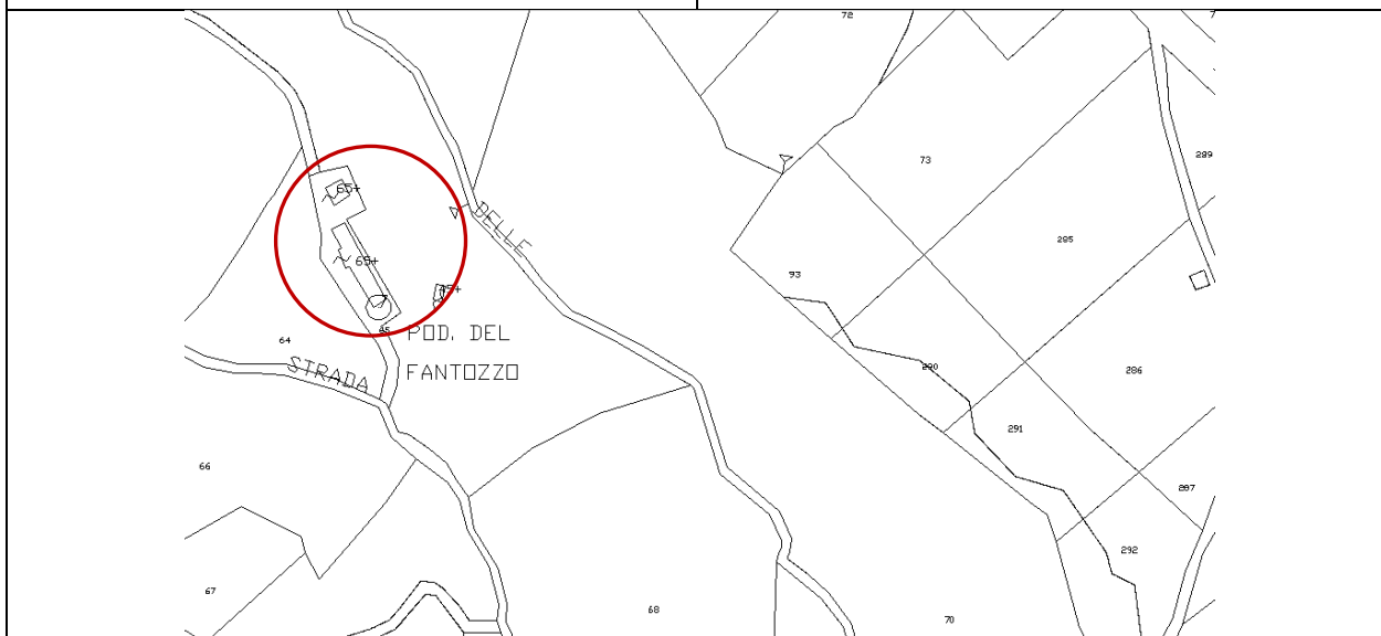
localizzazione su mappa catastale