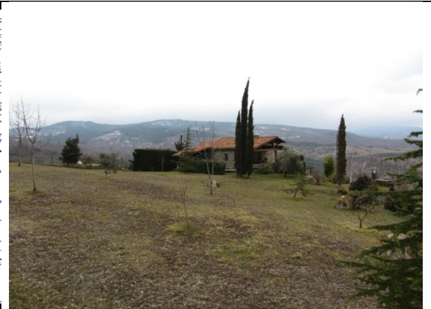
foto di insieme