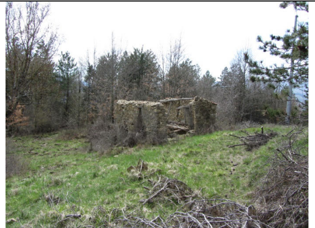
foto di insieme