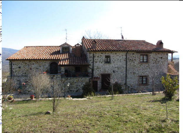
foto di insieme