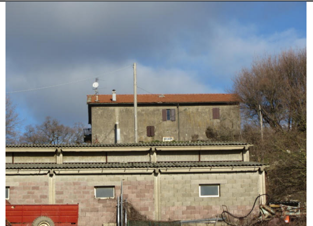
foto di insieme