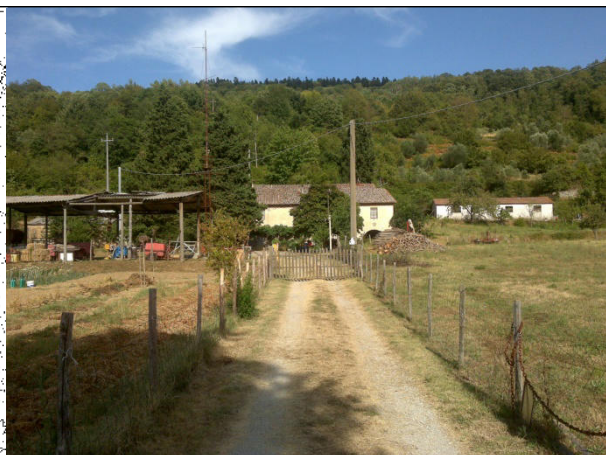
foto di insieme