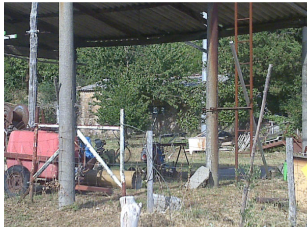
Foto 04 - annesso