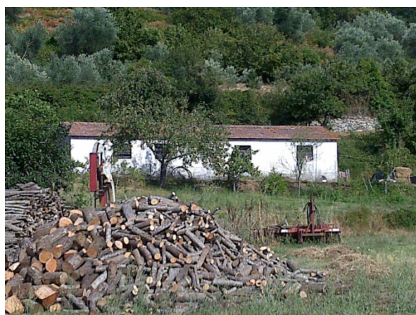
Foto 03 - annesso