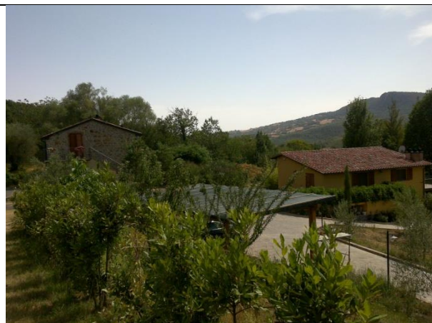
foto di insieme