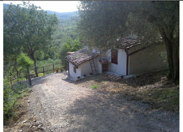
foto di insieme