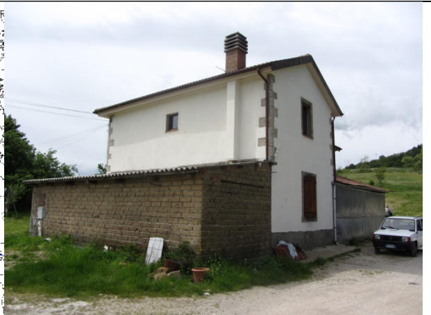
foto di insieme