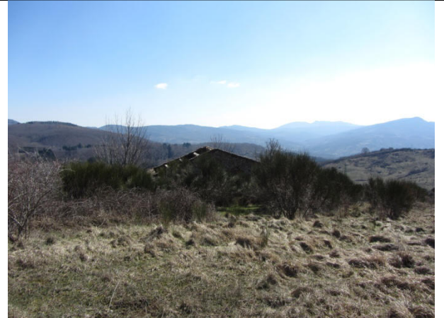
foto di insieme