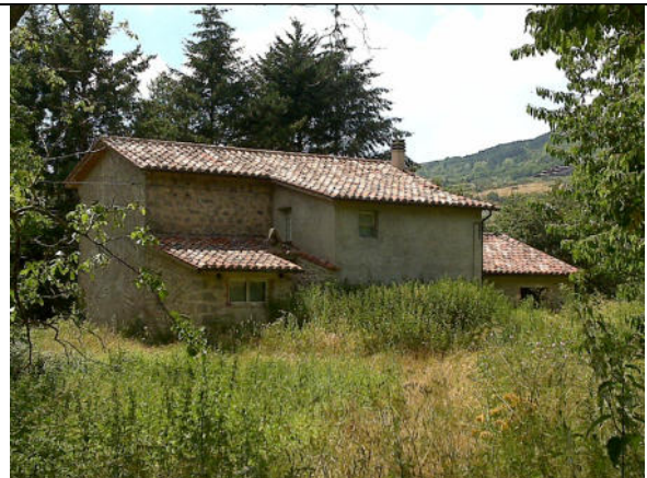
foto di insieme