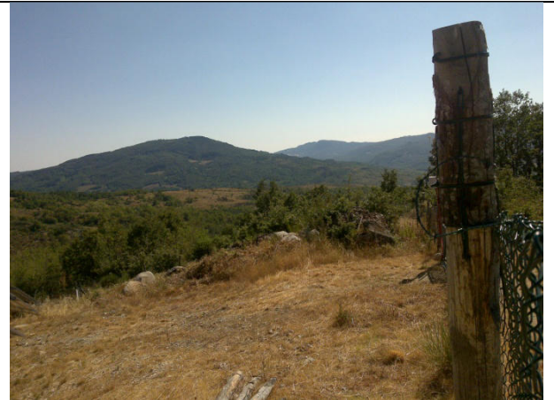
foto di insieme