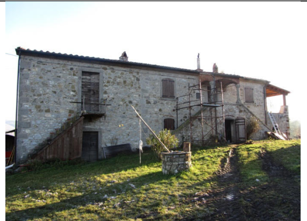
foto di insieme