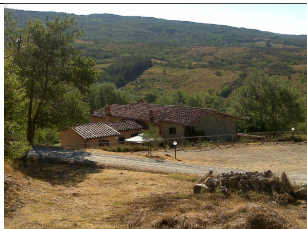
foto di insieme