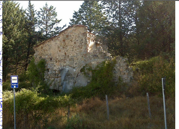
foto di insieme