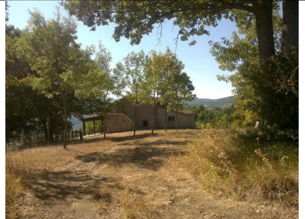
foto di insieme