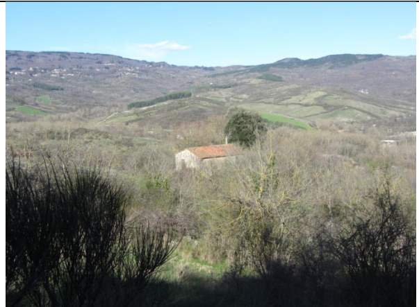
foto di insieme