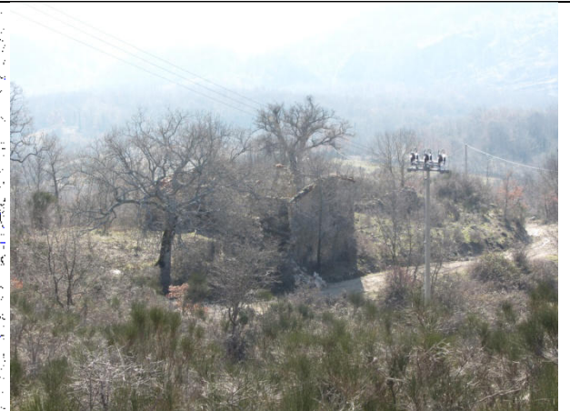
foto di insieme