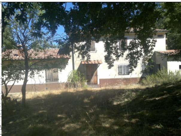
foto di insieme