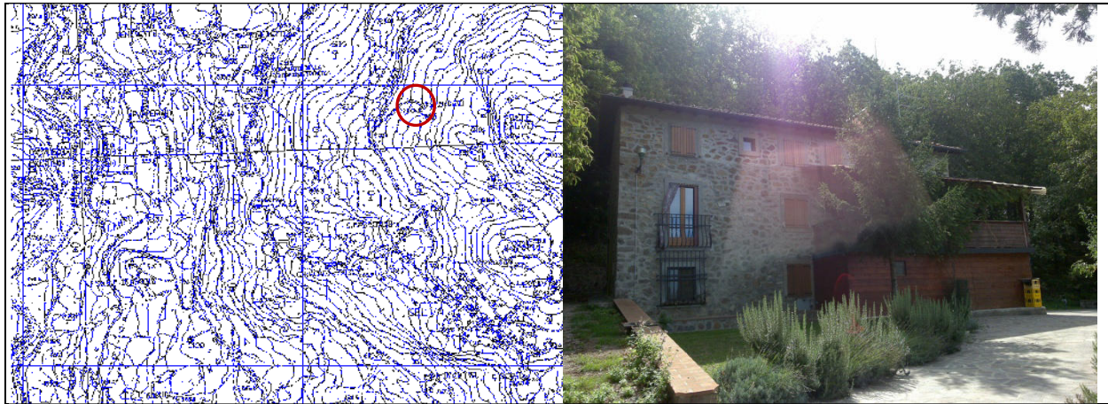
localizzazione su C.T.R.